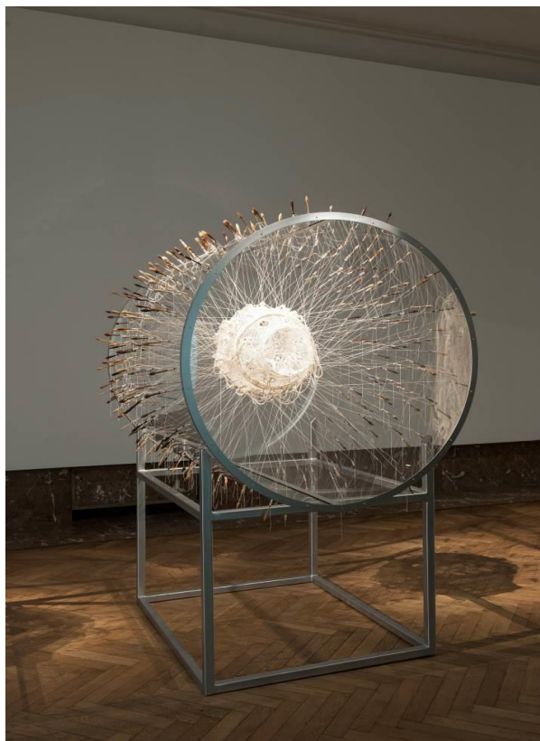
Maarten Vanden Eynde, The Gadget , 2017, Installation view