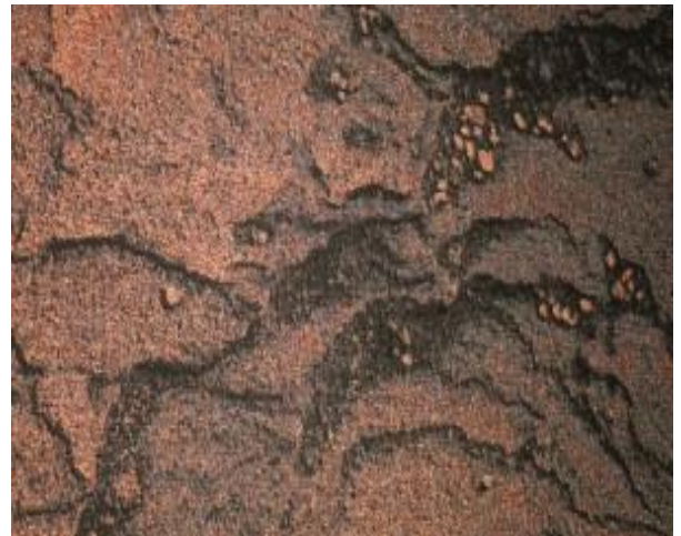
Otobong Nkanga, Steel to Rust - Meltdown (detail), woven textile, 2016.

Otobong Nkanga werd in 1974 geboren in Kano, Nigeria, en woont sinds negen jaar in Antwerpen. Recente solotentoonstellingen waren te zien in Nottingham Contemporary (2016), In Situ Gallery, Paris (2016), Berkeley Art Museum and Pacific Film Archive (2016), MHKA, Antwerpen (2015), Somerset House, Londen (2015), Portikus, Frankfurt (2015), Kadist Art Foundation Parijs (2015), en in de Performance Room van Tate Modern in Londen (2015). In 2016 werkte ze ook mee aan internationale projecten in Shanghai en Beirut (Landversation). Ze nam deel aan verschillende internationale groepstentoonstellingen, zoals de 13e Biënnale van Lyon (2015), de 31e São Paulo Biennial (2014), de 8ste Berlin Biennale (2014) en de Sharjah Biennial 11 (2013) en won de Yanghyun Prize 2015. In 2013-2014 was ze te gast bij het DAAD Berliner Künstlerprogramm – Artists-in-Berlin Program. In 2017 is nieuw werk te zien op Documenta 14 in Athene en Kassel.