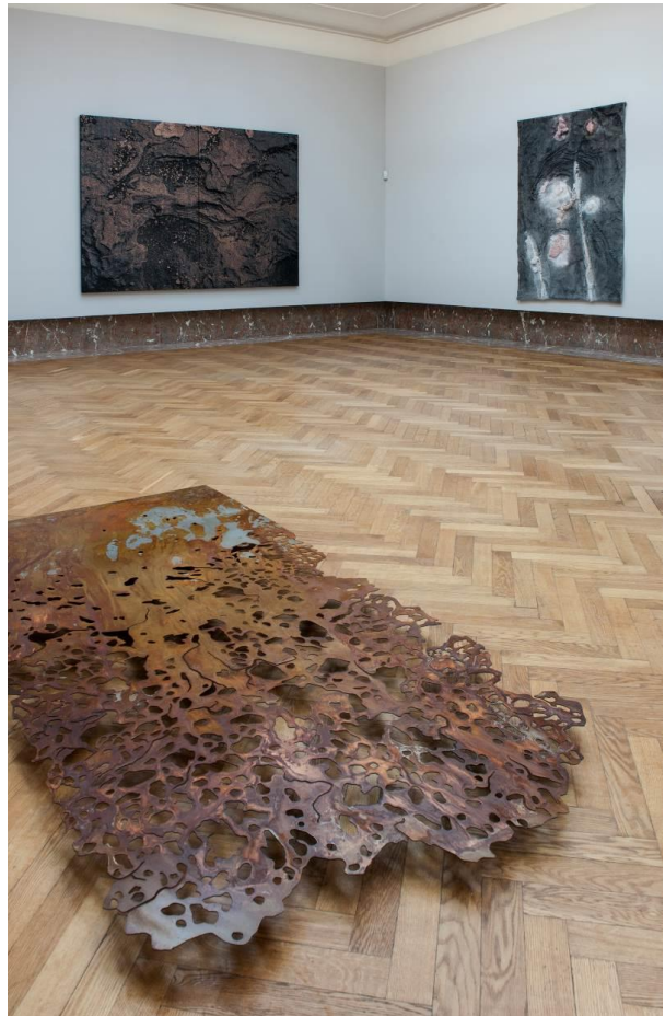
Otobong Nkanga, Steel to Rust - Slow Growth , 2017, Installation view

“Ik vind het fascinerend om dit transformatieproces te bekijken in het licht van het verleden en de werkelijkheid. We denken dat onze samenleving is gebouwd op ijzersterke waarden, maar onder het oppervlak zijn de onzichtbare processen van corrosie, kristallisatie en het ontstaan van nieuwe structuren al lang ingezet. En maar goed ook, want het is een teken van leven. Sluit je een gemeenschap, een idee of een natuurlijk proces hermetisch af, dan vertraagt het, vervormt het of stopt het met corroderen bij gebrek aan O 2 . Het stopt met ontwikkelen en sterft of versteend.” “Vandaag is het idee van grenzen sluiten en muren bouwen verbonden met een vrees voor contaminatie en verval. Maar nieuwe vormen creëren ook kansen, een samenleving blijft veranderen.”