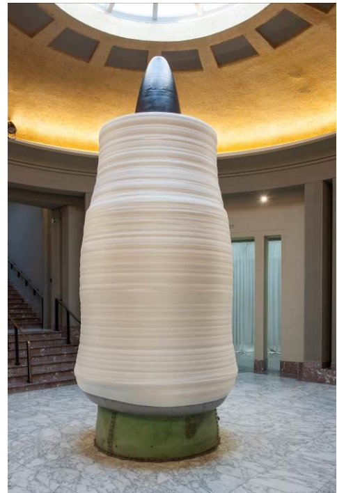
Maarten Vanden Eynde, Around The World , 2017. Installation view

Maarten Vanden Eynde (° 1977, Leuven, BE) werkt in Brussel (BE) en Saint-Mihiel (FR). De voorbije jaren stelde hij tentoon in 2050. A Brief History of the Future in Palazzo Reale, Milaan (2016) en in de Koninklijke Musea voor Schone Kunsten van België, Brussel (2015), Realités Filantes , #4 op de Biennale van Lubumbashi (2015), Beyond Earth Art in het Johnson Museum of Art in Ithaca (2014), The Deep of the Modern , Manifesta9 in Genk (2012), The Museum of Forgotten History , M HKA, Antwerpen (2012) en Dublin Contemporary (2011). In 2005 richtte hij samen met Marjolijn Dijkman de organisatie Enough Room for Space op, een mobiel platform voor locatiegebonden projecten.