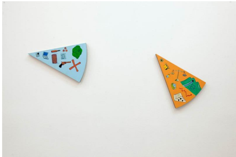
Maarten Vanden Eynde in collaboration with Musasa, Ils ont partagé le monde , 2017, Detail of the installation view

“De wereld zoals we die nu kennen zal niet blijven bestaan. In plaats van scherp te stellen op dat intrieste feit, focus ik liever op wat daarna zal komen, wat er overblijft en met welke puzzelstukjes we geschiedenis zullen schrijven. Subjectief? Absoluut! En daardoor een heel bevrijdende manier van werken. Wat ik mooi vind aan de genetologie of postapocalyptische wetenschap is dat iedereen ter verantwoording wordt geroepen. Of je iets doet of niet doet, het heeft allemaal een impact op de uiteindelijke geschiedschrijving want zelfs het kleinste voorwerp kan worden teruggevonden en representatief zijn voor de wereld van vandaag. Ik wil daar iets mee doen, niet alleen als kunstenaar, maar ook als mens.”